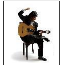
カニサレスコンサート