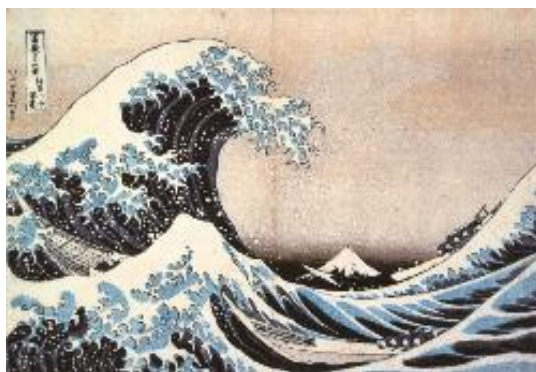
世界が絶賛した浮世絵師 北斎展 葛飾北斎《富嶽三十六景 神奈川沖浪裏》 中右コレクション