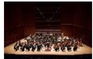
第8回八王子定期演奏会