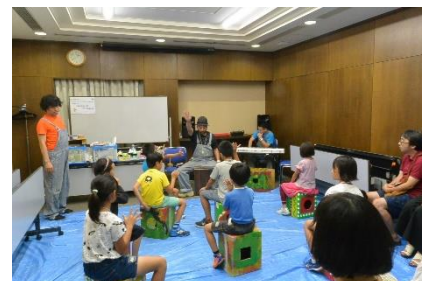
夏休み子どもいちょう塾