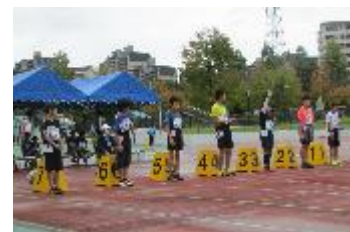
はちおうじダッシュ！

コニカミノルタ陸上競技部及びJR東日本ランニングチームコーチの指導のもと、月2回以上のジョギングスクールを実施します。