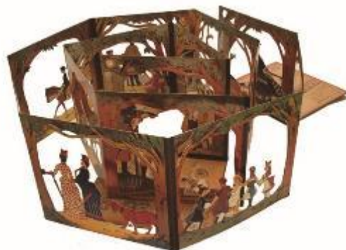
しかけがいろいろ! とびだす絵本展 ロタール・メッケンドルファー 《都市公園 (復刻版)》