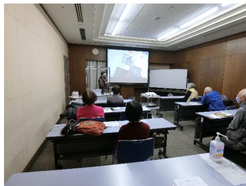
令和2年度後期講座 『はじめての絵本講座』学園都市センター