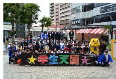
八王子地域合同学園祭 ★学生天国★