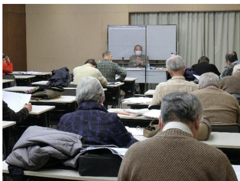
令和2年度後期講座 『キリスト教世界の誕生』学園都市センター