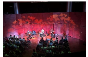
南大沢ジャズシリーズ