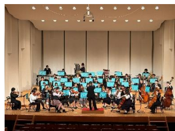
八王子ユースオーケストラ