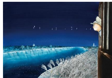
ますむらひろし《銀河鉄道の夜》