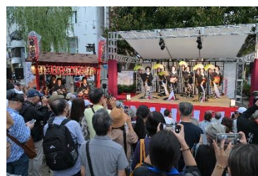
伝承のたまてばこ (R6 年度の様子「八王子芸妓衆」)

④八王子の街なかやホール、地域で気軽に音楽やアート、伝統芸能に 親しみ、その価値を再発見できる機会を創ります。