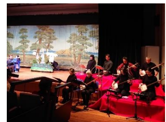
伝統文化ふれあい事業 合同発表会