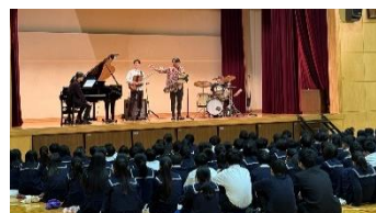
学校アウトリーチコンサート

③質の高い芸術文化の普及を図るため、気軽に足を運べる コンサートやトークイベント、学校等への演奏家派遣を行います。