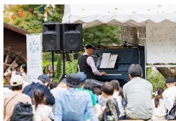
八王子芸術祭 (R5 年度の様子「詩をつくろう」)

③質の高い芸術文化の普及を図るため、気軽に足を運べる コンサートやトークイベント、学校等への演奏家派遣を行います。