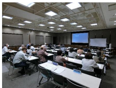
令和 6 年度後期講座