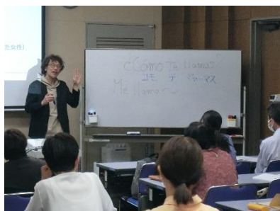
令和 6 年度前期講座