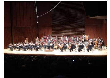
東京交響楽団定期演奏会