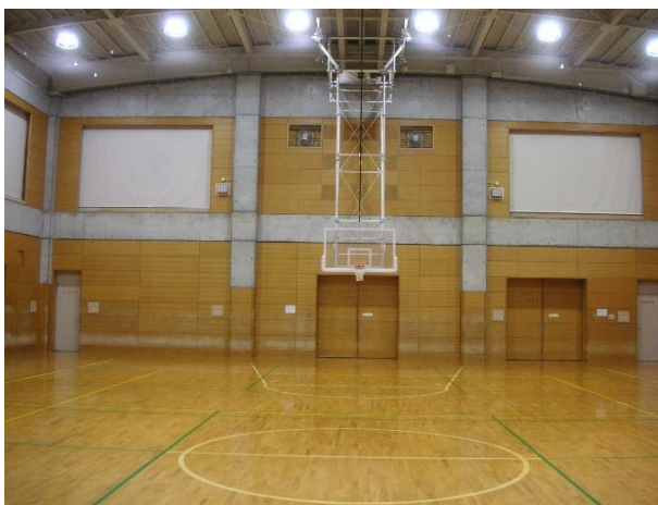
* ミニバス規格のゴールです