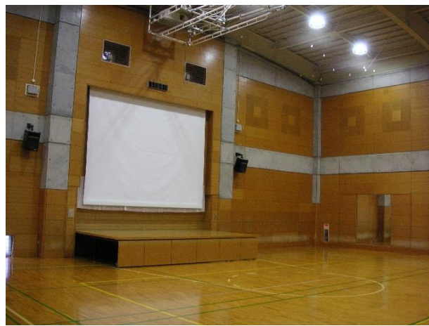
* 舞台・映写スクリーン・音響も完備 * 壁鏡もあります