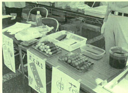
串ダンゴ(寺田町会)