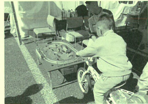
子どもの発電体験(トヨタ東京自動車大学校)