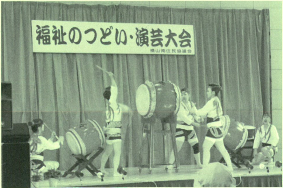
山田太鼓による勇壮な幕開け演奏