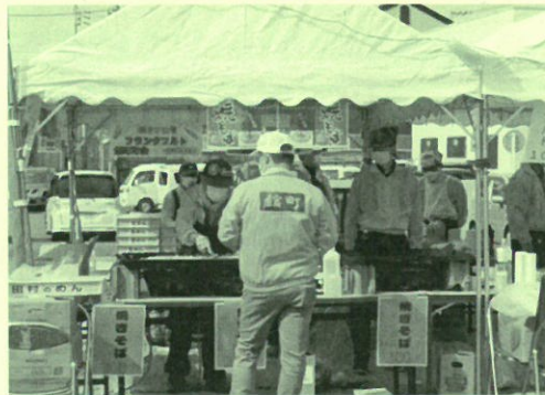
焼きそば(館町町会)