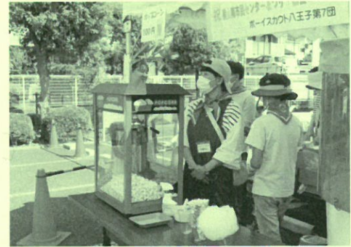
ポップコーン(ボーイスカウト)