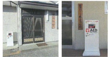
船田町会の会館と南アパートの第二集会所の入り口にも、AED機器が設置されました。24時間いつでも使うことができます。

地震の他に台風や大雨などの災害が多い日本では、自分で災害から逃れるための訓練、安全な避難経路の確認や持ち出す避難袋の確認などの他にも、他人を助けるための知識やスキルも必要です。 避難所での炊き出しの訓練や救命訓練も定期的に繰り返し行うことで、いざという時の行動につながります。 中でもAEDの使い方や胸骨圧迫の技術は、災害時以外でも役にたつ、万人が身につけるべきものではないでしょうか。 町会最大の住民数である長