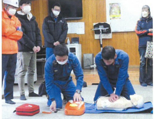
高尾消防署によるAEDの実演訓練