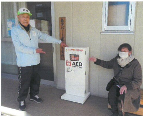
新しくAEDが設置されました