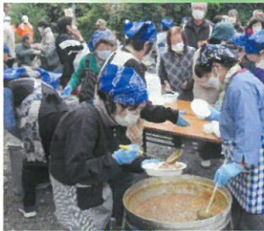
炊き出しの訓練では、 カレーを作り配りました