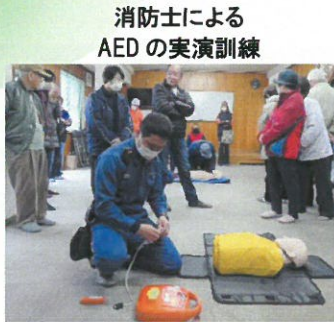
消防士による AEDの実演訓練

「AEDを使用した救命の手順」をスマホやPCで検索すると、機器の使い方や手順を説明するペーじや動画を見ることが出来ます。AEDが周辺に無い時、 胸骨圧迫 だけでも有効です。ご一読を。