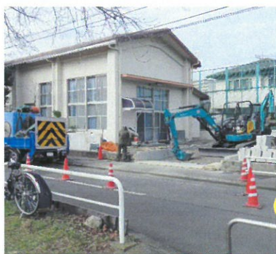
改築工事中の新しい横山事務所