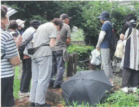
いのはなトンネル列車乗客無差別銃撃事件の慰霊をしました