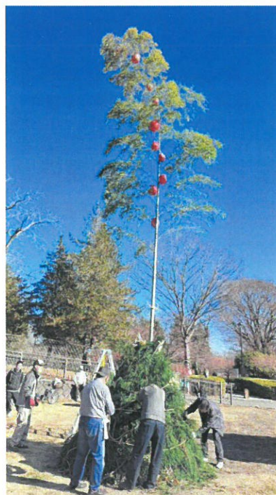
古い正月飾りを集めて準備完了

しめ縄や門松を焼き上げ、年神様を天へと帰す正月の恒例行事、どんと焼きを令和六年一月八日十時から、中郷町の広場で実施しました。