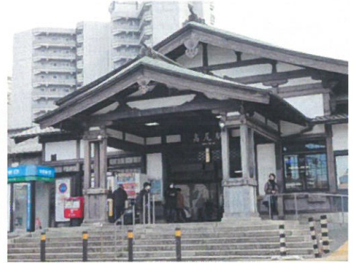
中央線「高尾駅」明治34年甲武鉄道「浅川駅」として開業その後、新宿御苑仮駅舎を移築