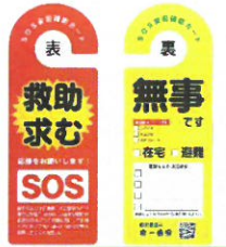
門やドアにかけて使う SOS 安否確認カード

緊急事態宣言が明けた昨年の秋、長房の各地区では久々の防災訓練が行われました。一部地区で、新しい試みとして導入されたカードを使った安否確認訓練は、各戸口にかかれた「無事」と「救助求む」のカードを区長と見回り隊が確認して回るものでした。 孤立の危険が大きい高齢者世帯が多い地域では、特に重要度が高い訓練でした。 また、この訓練には、町会未加入世帯からの参加も多く、震災に備えた防災への関心の高さがうかがえました。