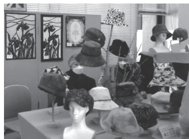
手作り帽子のお気に入り

体育室の会場準備は担当した体育部会の参加メンバーが少数だったため、出演者の皆様にご支援を頂いて前日の午前から着々と行われました。