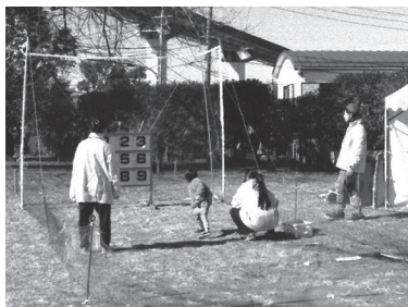
ストライクの瞬間

おいちよう広場では、松が谷高校生徒会の皆様にご支援を頂いて「ストラックアウト」と「輪投げ」コーナーが開催され、子供達の喜びの歓声が上がっていました。