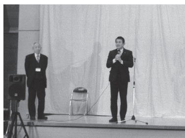
初宿市長と越智会長