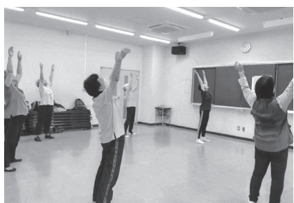
高く高く、そして深呼吸

見学や、参加してみたいと思われる方は、いつでも歓迎です。お気軽にご連絡下さいませ。