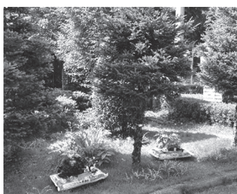
敷地内手作り花壇

ただ建物を守るだけではなく、昔の下町の長屋の様に、住んでいる皆が顔を合わせて話し合えたり、お互いに助け合ったりしながら、住民の皆が『ここに住んで良かったな』と思えるマンションを目指していきたいと思っています。現在は、理事会主催でのイベントはまだまだ足りませんが、