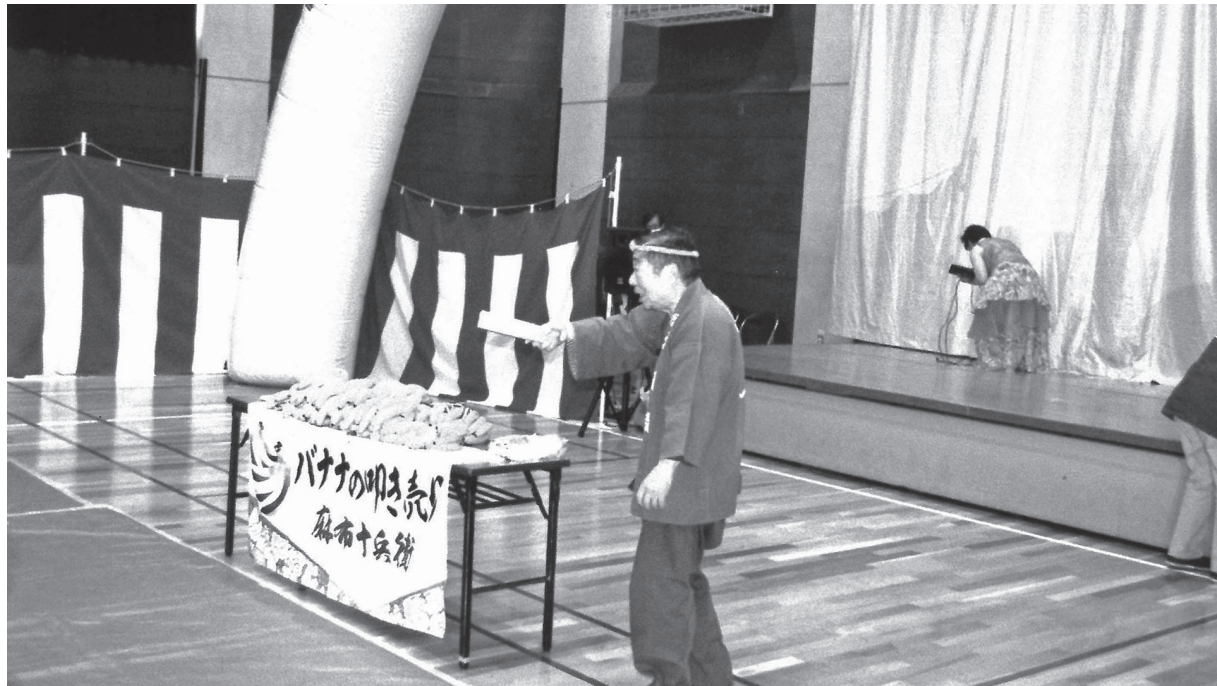
令和7年由木東市民センターまつり特別公演 麻布 十兵衛氏 バナナのたき売り「よし気に入った。売ろう」