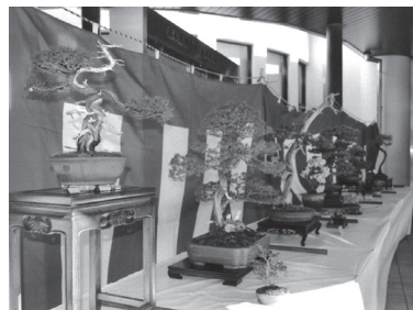
最終参加の盆栽展示

加もあり賑わっていました。メカイ、小物、手作り品などの他に、新たに缶バッジも販売され、人気の食品ではパンやジャム、焼きそば、フランクフルト、焼き鳥、おしるこなどに手が伸びていました。