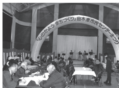
フードコートでお楽しみ