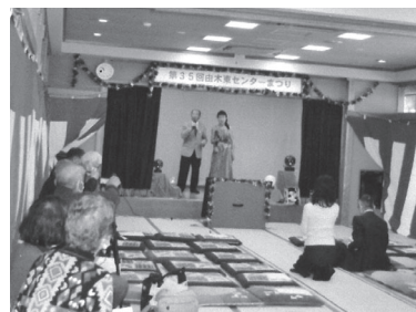
デュエットを楽しむ

他には、アマチュア無線クラブの展示実演もあり、さらにお茶席の野点コーナーでは、椅子に座しての立礼式の茶道で、無理のない作法にて接待頂きました。