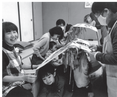
トンネル遊びは楽しいな