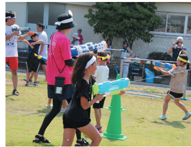
本気になって駆け回った水鉄砲 敵チームの的をめがけて発射！