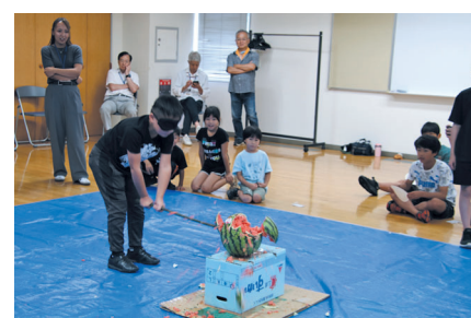
盛り上がったスイカ割り 一刀両断です！お見事！

2日目は学生さんが企画し、地域の皆さんがあらかじめ集めてくれた段ボールを使って、切つて、貼つて、つなげてつなげて、段ボール迷路が完成！子どもも大人も一生懸命になって、多目的室に姿を現した手づくり迷路で楽しみました。さらに段ボールをみんなで片付けた後は、毎年恒例のお楽しみ、スイカ割りです。始める前にグルグルと回つても、平衡感覚を失わず正確にスイカに当てる子が続出で驚きでした。 最終日となる3日目は、会場を加住小中学校本校舎校庭に移し、加住小中学校PTAが企画した水鉄砲遊びで大いに盛り上がりしました。それぞれが、的となる金魚すくいを使う「ポイ」を額に付け、水鉄砲を手にしてゲームスタート！積極的に相手の的を狙いに行く子もいれば、攻撃を避けて避けて、一瞬のスキを突く一発必中！に賭ける子もいて、作戦の違いが戦い方によく表れていました。ゲームの合間には夏の定番のかき氷が振舞われ、いろいろな味のシロップで楽しみました。そして最後は、みんながビショビショに濡れながらも、充実の笑顔を見せてくれました。 この日、無事迎えることができた閉講式では、3日間すべてに出席した小学生と中学生ボランティアに、加住地区住民協議会から「皆勤賞」が贈られました。 さて、今年度もサタデース