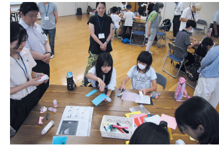
ヤクルトロケットづくり みんなで丁寧につくりました。

令和7年7月26日・8月16日・8月23日の3日間に行われ、加住地区住民協議会主催のサタデースクールが開講されました。 1日目と2日目は加住市民センターを会場に、それぞれ学習とヤクルトロケットづくり、段ボール迷路遊びとスイカ割りという内容。 1日目はまず学習から開始。夏休みの宿題などを、学生のボランティアのお兄さん・お姉さんなどに聞きながら進めます。その後は加住市民センター図書室担当者の皆さんの指導で乳酸菌飲料の空き容器を利用した「ヤクルトロケット」づくり挑戦！勢い良く飛んだロケットがあれば、あら？となったロケットもあり、さまざまでした。