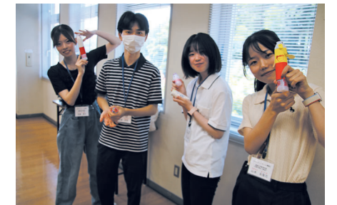
ボランティアの皆さん 学生から教員まで参加です。

令和7年7月26日・8月16日・8月23日の3日間に行われ、加住地区住民協議会主催のサタデースクールが開講されました。 1日目と2日目は加住市民センターを会場に、それぞれ学習とヤクルトロケットづくり、段ボール迷路遊びとスイカ割りという内容。 1日目はまず学習から開始。夏休みの宿題などを、学生のボランティアのお兄さん・お姉さんなどに聞きながら進めます。その後は加住市民センター図書室担当者の皆さんの指導で乳酸菌飲料の空き容器を利用した「ヤクルトロケット」づくり挑戦！勢い良く飛んだロケットがあれば、あら？となったロケットもあり、さまざまでした。