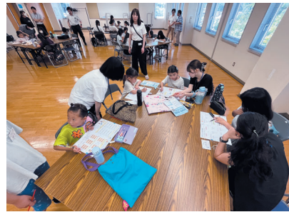
夏休みの宿題も進めました 先生や先輩がアドバイスをくれます