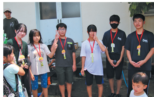
中学生ボランティアも皆勤賞 3日間よく頑張りました 来年度もよろしくね！