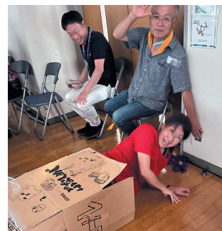
キャー！段ボールから？ 出てきてビックリ！