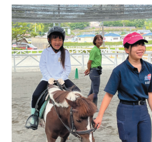
貴重な体験に大満足！ (八王子乗馬倶楽部で)

令和7年7月30日(水)から8月1日(金)までの3日間にわたり、本年度のサタデースクール特別企画「乗馬体験」が開かれました。