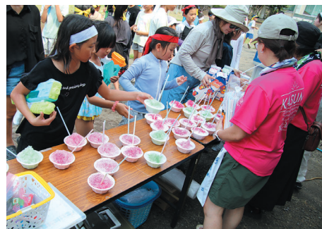
暑い！美味しかったかき氷 好きな味のかき氷を選びました