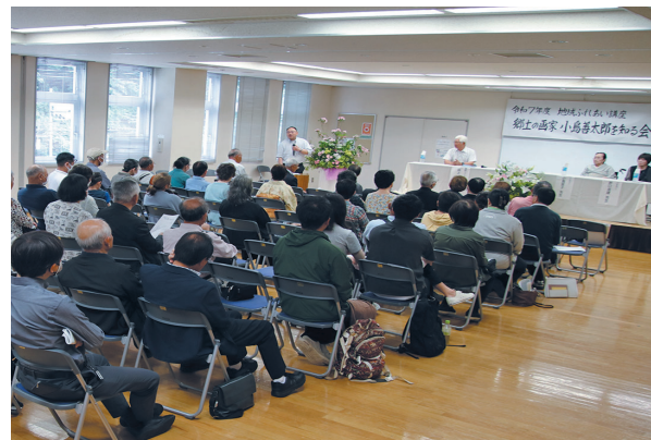
当日は多くの聴講者が来場