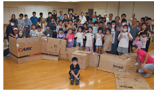
段ボール迷路をつくったよ 渾身の作品の前で、はい、チーズ！