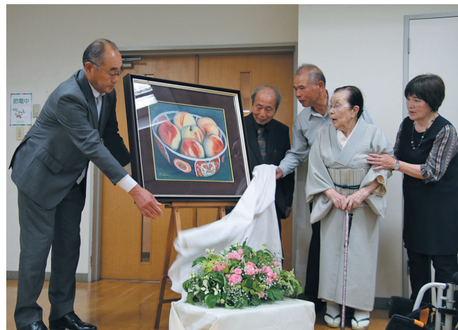
小島善太郎作「桃」の除幕披露