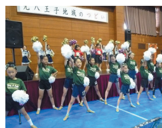
チアダンス(アローレ八王子)