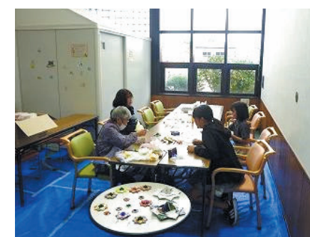
折紙教室(八王子市赤十字奉仕団)