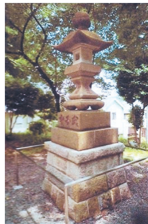
八幡神社境内(元八三丁目)

次回からは「地域の人物シリーズ」を掲載します。第1回は平安時代に深澤山(城山)で修行した僧「妙行」です。ご期待ください。