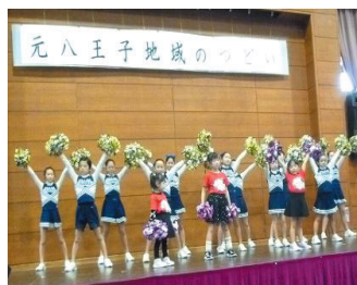
バトントワリング CRONY