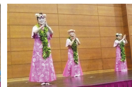
フラダンス（プアナニ）