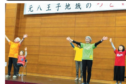
手話ダンス（新婦人）