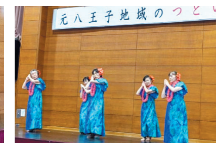
フラダンス（ラナマナオ）