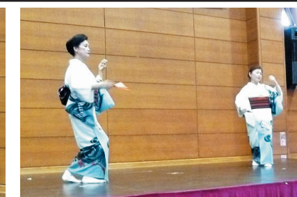
舞踊（花うえ民謡会）