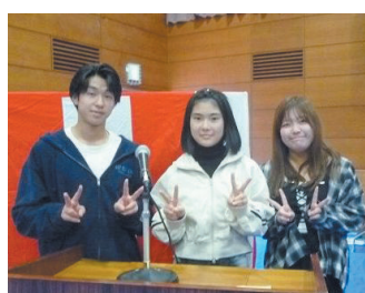
音響担当（星槎国際高校）