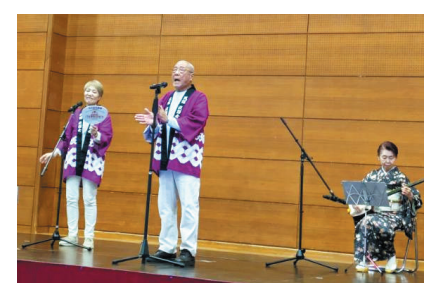
佐渡おけさ（淡詔会）