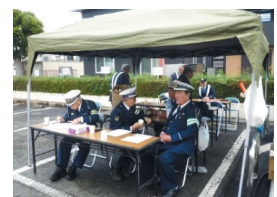
交通安全協会の皆さん