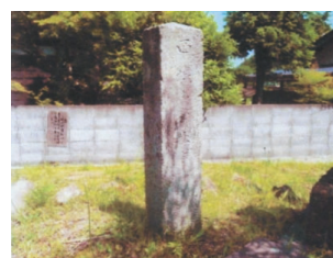
宗関寺入り口(元八三丁目)