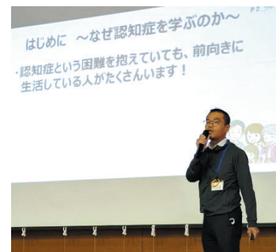
講演「認知症サポーター養成講座」