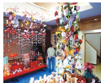
生涯学習を実践している皆さんの作品