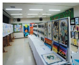
地域の小学生・中学生の作品