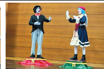
オルゴール人形振り(ドレミふぁ共和国)