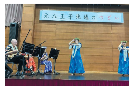
フラダンス（フィオ フラ）