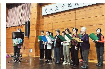
八王子城歌（みんなで歌おう会）