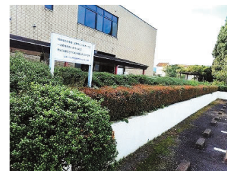
きれいに整備された植栽エリア

昨年10月11日、町会・自治会、各種団体、住民協議会などの有志により元八王子市民センター構内の草刈を実施しました。当日は小雨模様でしたが20名の方が参加し雑草を取ったり植木の剪定を行いました。参加された皆さん、ご苦労さまでした。