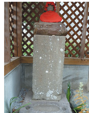
七面堂境内(元八一丁目)