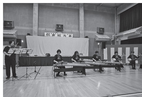
琴・ヴァイオリン演奏