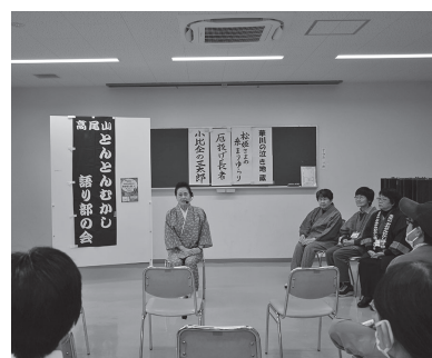
とんとんむかし話