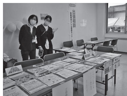
高齢者何でも相談