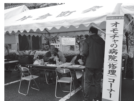
おもちゃの病院（屋外）