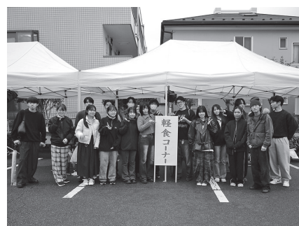
軽食コーナー（屋外）