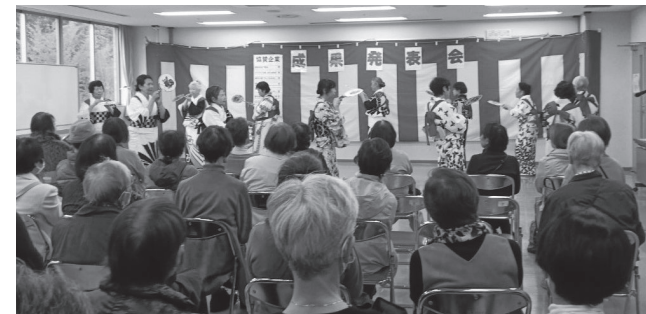
成果発表 (杉谷戸クラブ 民踊の会)