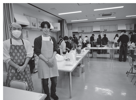
軽食コーナー（調理室）