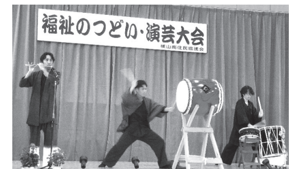
太鼓 太鼓会 はちはち