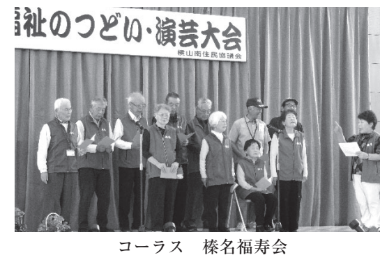
コーラス 榛名福寿会

日時 令和7年10月17日(金)：設営準備日、天気：晴 令和7年10月18日(土)：第1日目、天気：晴 令和7年10月19日(日)：第2日目、天気：晴後雨