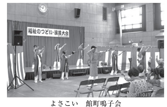
よさこい 館町鳴子会